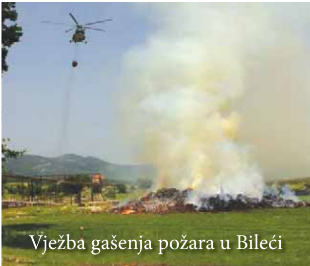
Vježba gašenja požara u Bileći

Na zajedničkoj vježbi gašenja požara održanoj 11. 06. 2010. godine u Bileći, koja je bila u organizaciji 4. pješačke brigade OS BiH, pored pripadnika brigade sudjelovale su i postrojbe brigade ZS i PZO OS BiH, kao i postrojbe vatrogasnih društava općina Bileća i Trebinje. Pripadnici 1. helikopterskog skvadrona iz Banja Luke sudjelovali su s dva helikoptera MI-8T sa zadaćom gašenja požara protupožarnim vedrom PPV -2.000, kao i jednim helikopterom tipa SA -342 „Gazela“ sa zadaćom izviđanja rejona požarišta i medicinske evakuacije. Na taktičko-tehničkom zboru, održanom izravno prije vježbe gašenja požara, pripadnicima vojno diplomatskog kora stranih zemalja i predstavnicima Ministarstva obrane BiH i Operativnog zapovjedništva OS BiH, prikazane su taktičko-tehničke mogućnosti helikoptera MI -8 i SA -342 "Gazela" pri gašenju požara i medicinskoj evakuaciji.